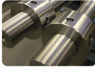
Säulen für eine Presse