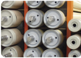
Umlenkwalzen aus St-Metall

Gedreht, gefräst, geschliffen, beschichtet von \varnothing 60 – 500 mm